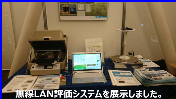
無線LAN評価システムを展示しました。 (電波シールドボックス、ソフトウェア)