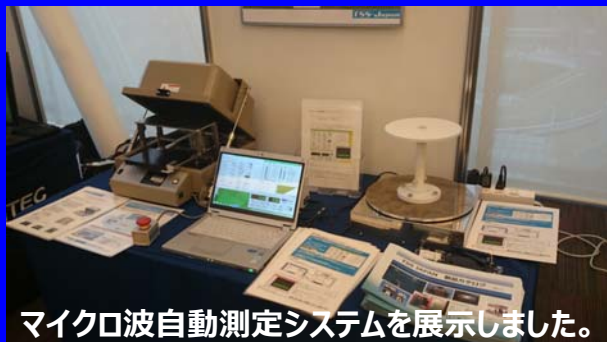
マイクロ波自動測定システムを展示しました。 (ターンテーブル、ソフトウェア)