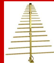
LogPeri アンテナ 80MHz~7GHz