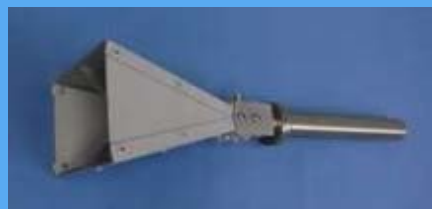
Horn アンテナ BBHAシリーズ 200MHz~40GHz

ISO17025認証を取得しており、 国際的に通用する校正書類の 提出が可能です。