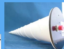
Conical Log Spiral アンテナ 1~10GHz