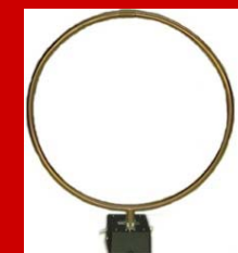
Loop アンテナ 1kHz~60MHz