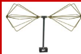
Biconical アンテナ 20MHz~18GHz