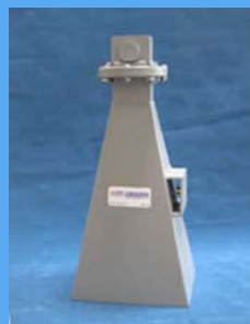
Horn アンテナ 3160シリーズ 1~40GHz