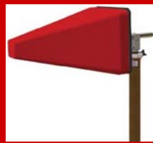
Double LogPeriアンテナ 300MHz~8GHz

ヨーロッパ最大の電波暗室メーカーが提供する、高品質で信頼性の高い 測定アンテナです。