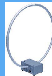
loop アンテナ 10kHz~30MHz