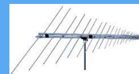
LogPeri アンテナ 20MHz~5GHz

TSSジャパンは、ご希望のアンテナを各メーカーより輸入販売いたします。 アンテナに関するメーカーへの問い合わせにも対応します。 お気軽にお問合せ下さい。