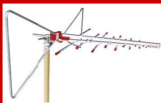
Broad Band アンテナ 25MHz~8GHz